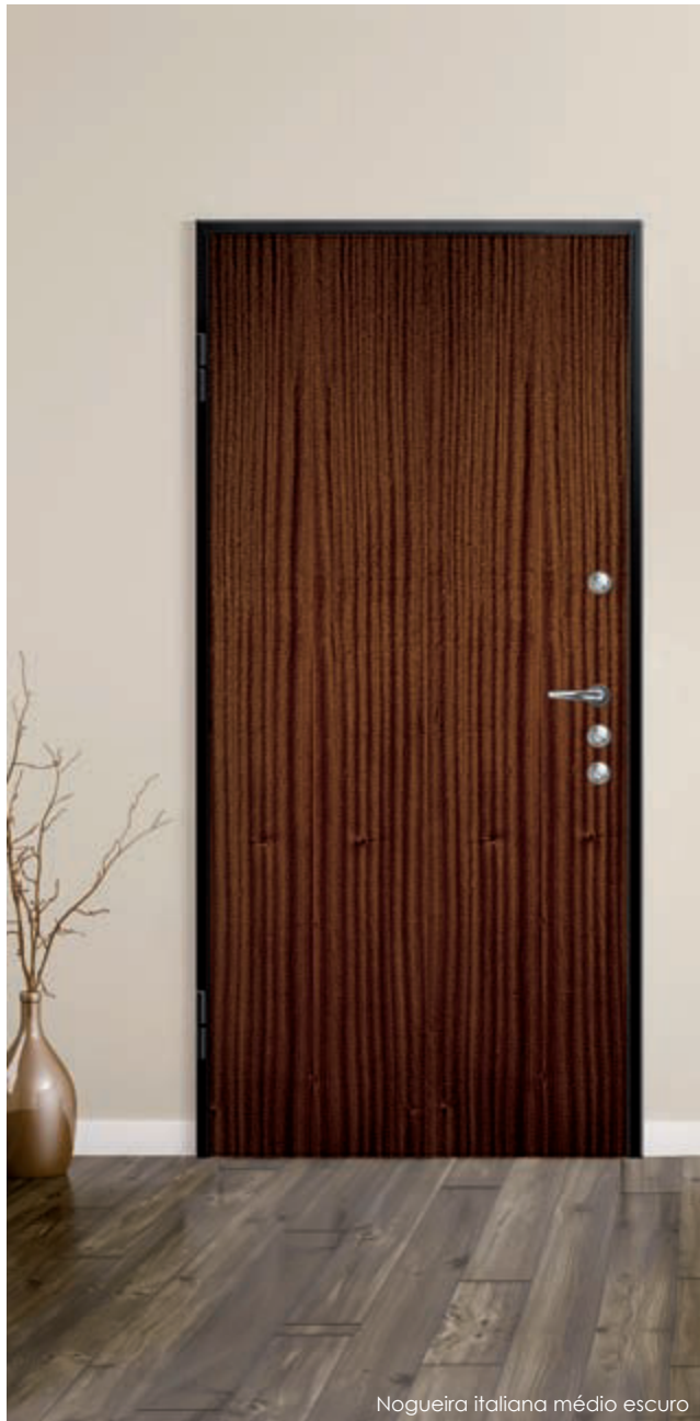
Nogueira italiana médio escuro